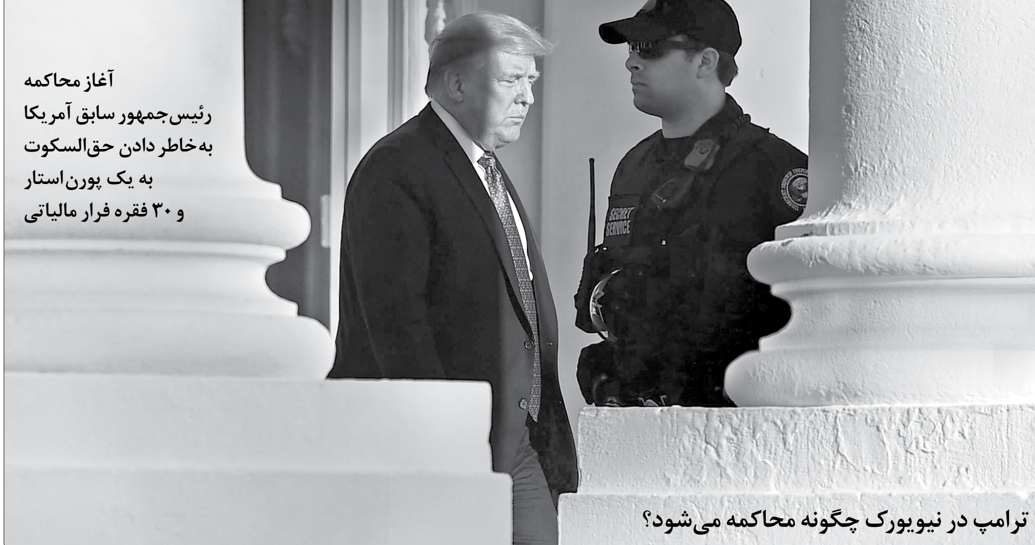
ترامپ در نیویورک چگونه محاکمه می‌شود؟

آغاز محاکمه رئیس جمهور سابق آمریکا به خاطر دادن حق‌السکوت به یک پورن‌استار و ۳۰ فقره فرار مالیاتی