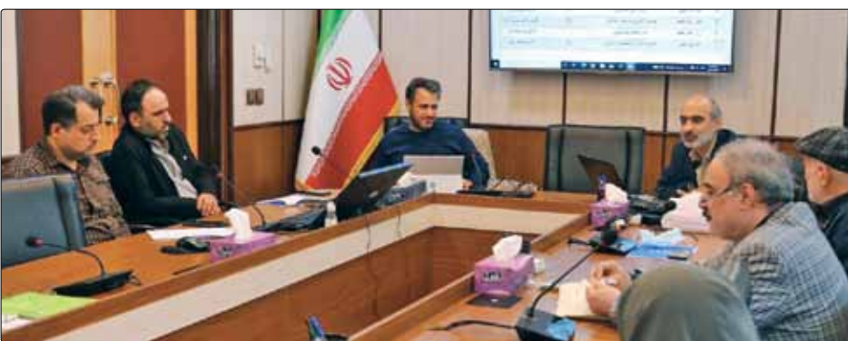
اعضا قرار گرفت. ساترا ۲ شورای راهبردی و تخصصی ساترا برای راهبری تولیدات بومی رسانه‌های صوت و تصویر فراگیر است که شورای صدور مجوز تولید و شورای صدور مجوز انتشار