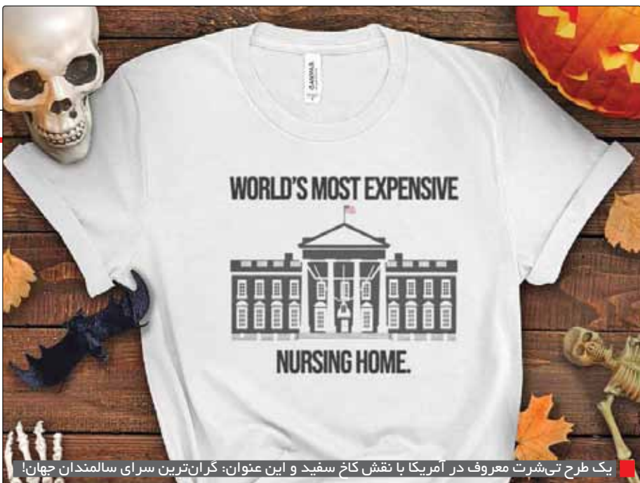
یک طرح تی شرت معروف در آمریکا با نقش کاخ سفید و این عنوان: گران ترین سرای سالمندان جهان!

۸۲ تا ۸۶ ساله خواهد داشت. بر این اساس باید گفت کاخ سفید به مدت ۱۲ سال متوالی کاخ سالمندان بوده است. نگاهی به مدعیان اصلی کارزار انتخابات ریاست جمهوری ۲۰۲۴ ایالات متحده گویای همه چیز است. جو بایدن ۸۰ ساله حتی به رغم شواهد آشکار عدم هوشیاری شخصی، رسوایی پرونده فساد مشترک با پسرش هانترو خشم عمومی نسبت به ناکارآمدی دولتش در جلوگیری از وقوع رکود اقتصادی، حاضر به کناره گیری از قدرت نبوده و کماکان گزینه نخست دموکرات ها برای حفظ