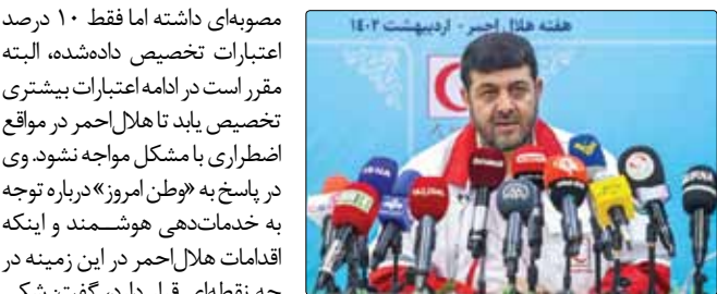
هفته هلال احمر - اردیبهشت ۱۴۰۲

نیروی انسانی جوان، مسؤلیت‌پذیر و کاردان اشاره و بیان کرد: باید کارهای پژوهشی را در هلال‌احمر گسترش دهیم. وی گفت: طرح نذر آب همچنان ادامه دارد و فقط بحث تامین مستقیم آب نیست. رئیس جمعیت هلال‌احمر با اشاره به موضوع اضطراب حادثه‌دیدگان در بلايا و حوادث گفت: کمک به این بیماران توسط تیم‌های سحر انجام می‌شود و فعالیت این افراد اثربخش است. در زلزله خوی و حادثه متروپن این موضوع بسیار مشهود بود. وی در پاسخ به پرسشی درباره همکاری هلال‌احمر با صلیب سرخ در روسیه گفت: همکاری دوجانبه و چندجانبه با کشورهای مختلف از جمله روسیه داریم و صادرات تجهیزات پزشکی تولیدی ما به روسیه انجام می‌شود. همچنین تجارب موفق را منتقل می‌کنیم. کولیوند در پاسخ به پرسشی درباره استفاده از ظرفیت سربازان در این جمعیت گفت: خوشبختانه ستاد کل نیروهای مسلح همکاری خوبی با جمعیت هلال‌احمر دارد و امسال هم سهمیه سالانه سربازان را به ۲۰۰ نفر برای جمعیت هلال‌احمر افزایش دادند.