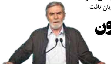
شهادت مظلومانه رئیس مذهب جعفری حضرت امام صادق علیه السلام را به عموم شیعیان تسلیت می‌گویم