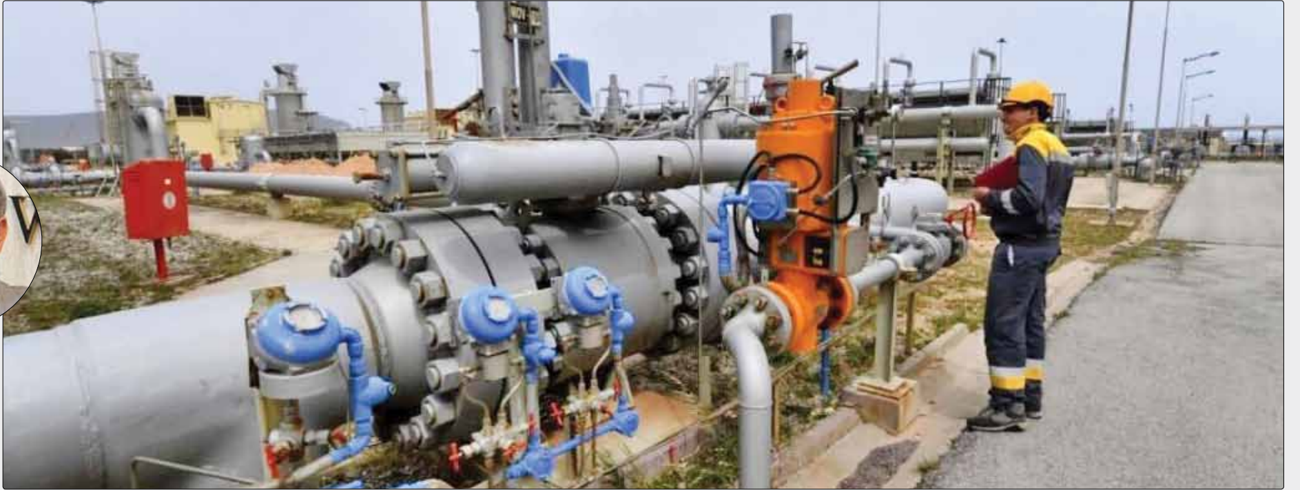
از سرگیری واردات روزانه ۱۰ میلیون متر مکعب گاز از ترکمنستان پس از ۷ سال