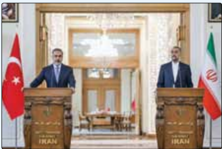
امیرعبداللهیان در دیدار با وزیر خارجه ترکیه

قرار گیرد. وی ادامه داد: ایران و ترکیه قرار گذاشتند هدف‌گذاری تبادل اقتصادی آنها به ۳۰ میلیارد یورو برسد.