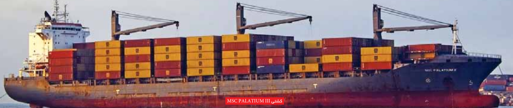
کشتی MSC PALATIUM III