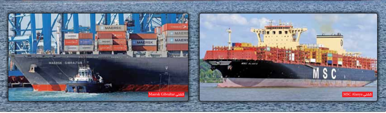
کشتی Maersk Gibraltar