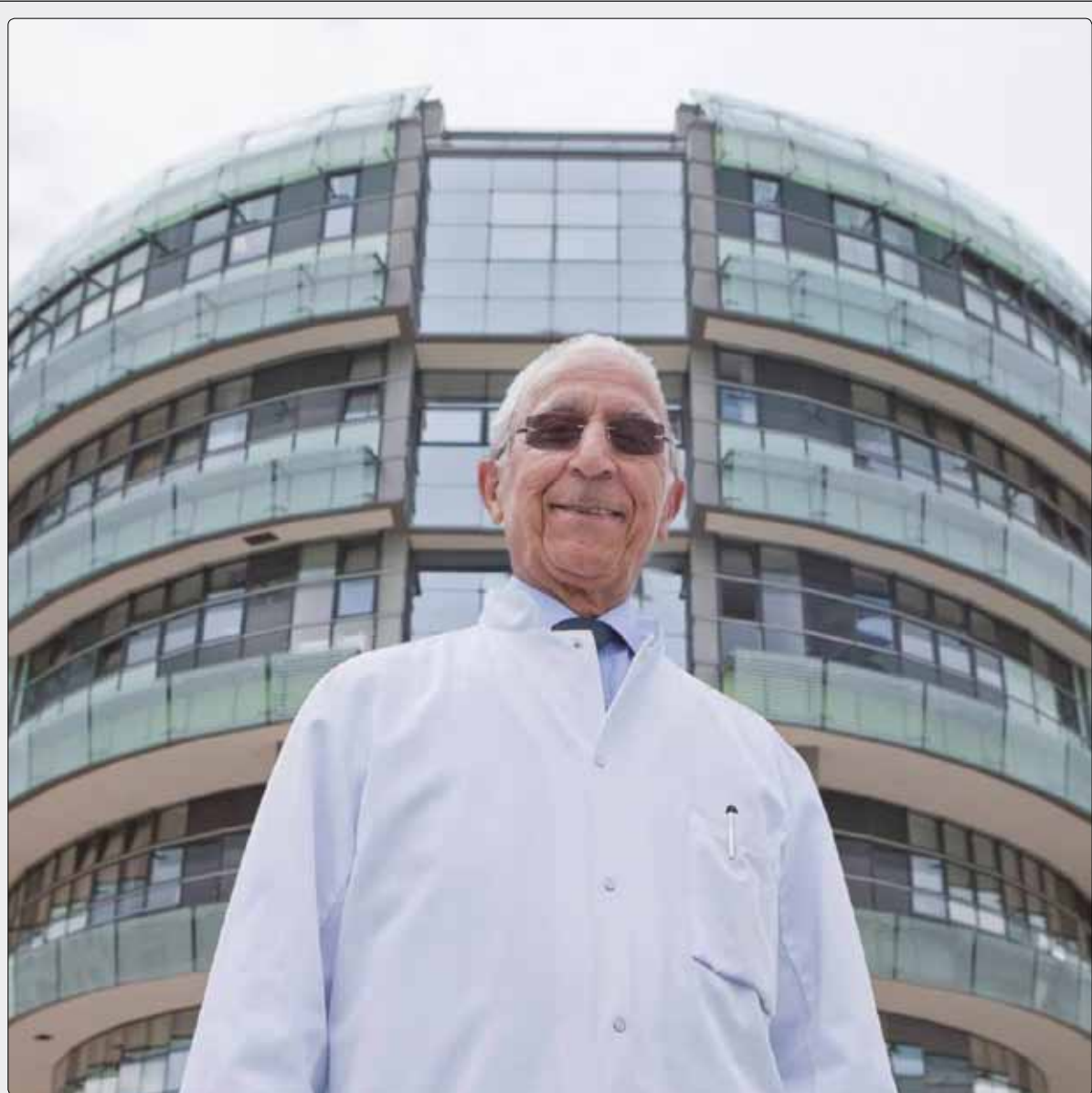
نمایش ضدایرانی جدید ضدانقلاب؛ این بار علیه پروفیسور سمیعی