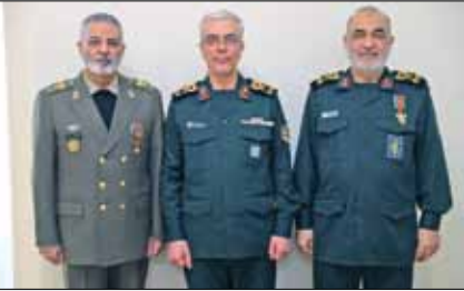
فرماندهان کل ارتش و سپاه