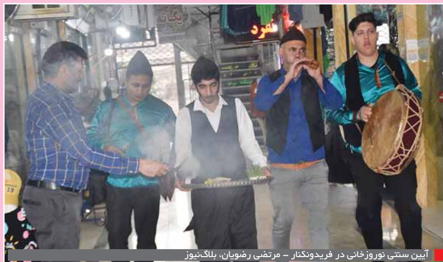
آیین سنتی نوروزخانی در فریدونکنار - مرتضی رضویان، بلاگ‌نیوز