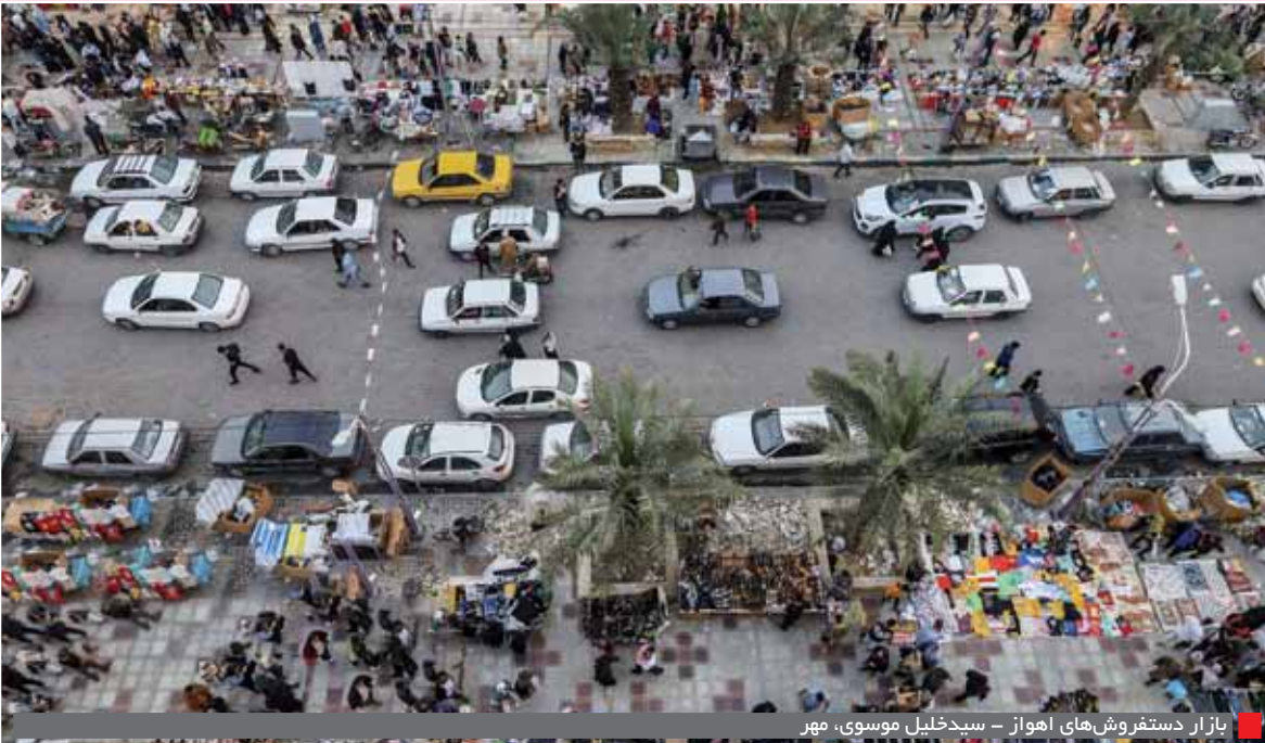
بازار دستفروش‌های اهواز