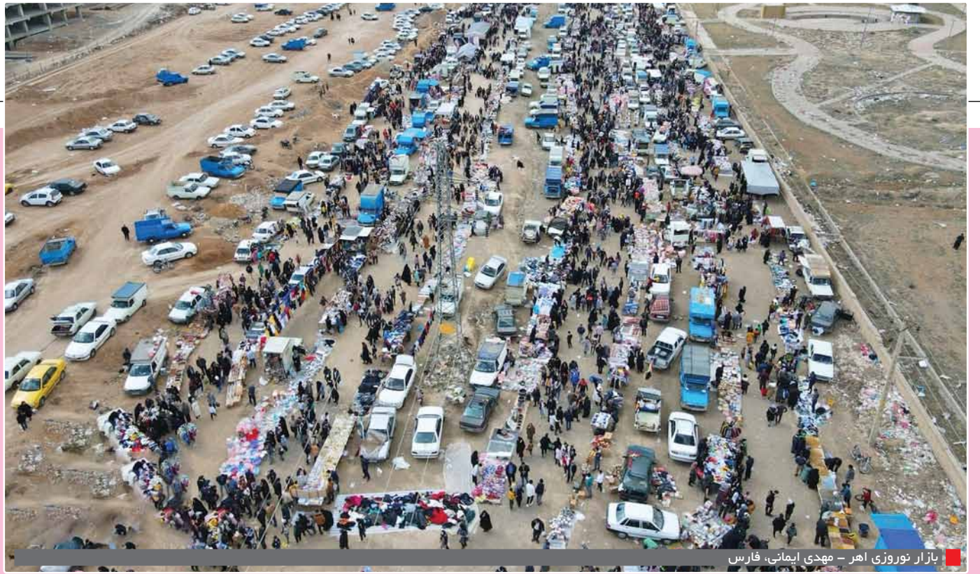
بازار نوروزی مهر - مهدی ایمانی، فارس