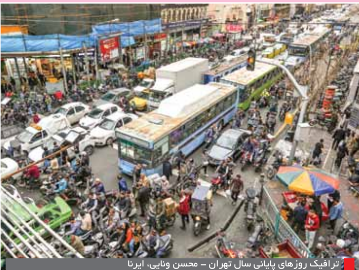
ترافیک روزهای پایانی سال تهران