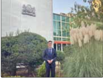
«تخصیص زمین و تسهیلات مر حله‌ای» راهکار تسریع نهضت مسکن و مشارکت مردم در تولید