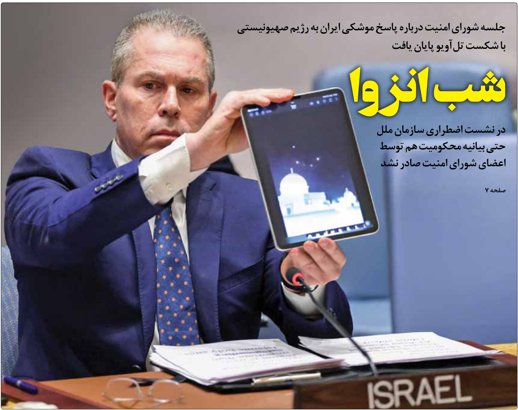
جلسه شورای امنیت درباره پاسخ موشکی ایران به رژیم صهیونیستی با شکست تل آویو پایان یافت