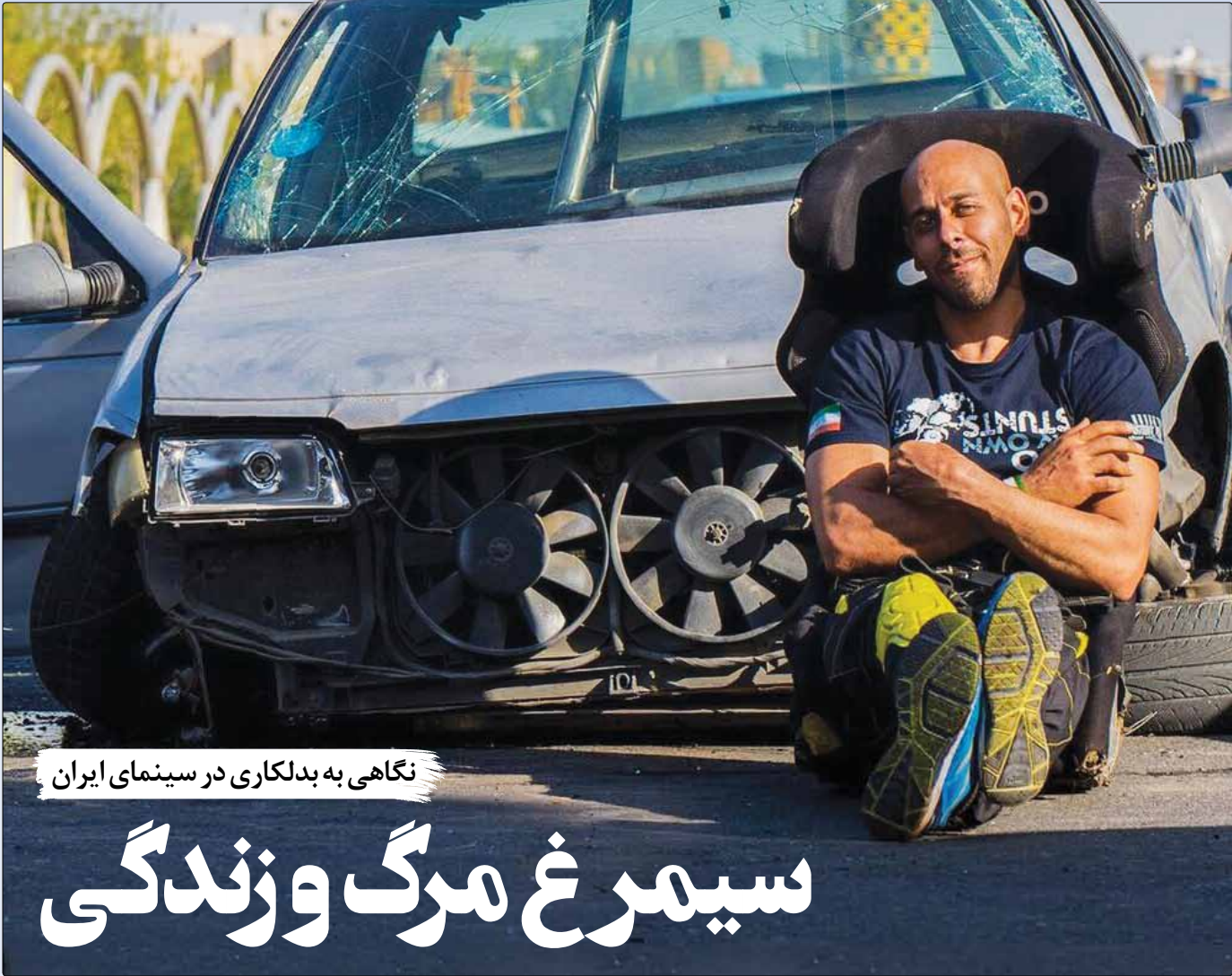
نگاهی به بدلکاری در سینمای ایران