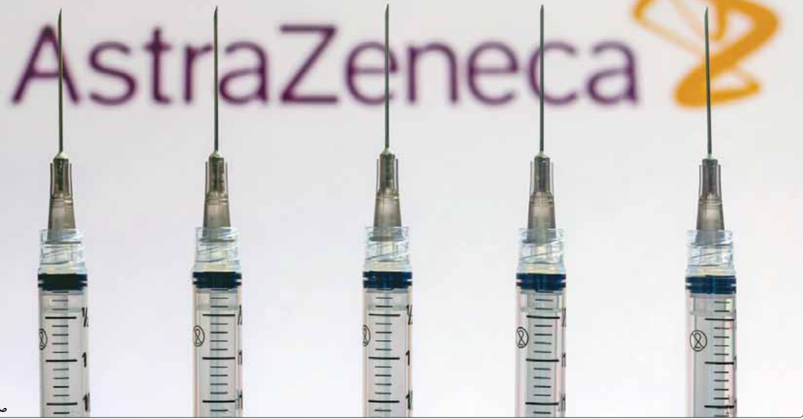
صفحه ۴