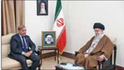
حضرت آیت‌اللہ خامنہ‌ای، رہبر انقلاب اسلامی عصر دیروز در دیدار آقای «شہباز شریف»، نخست‌وزیر پاکستان و ہیات ہمراہ، ضمن تشکر صمیمانہ از ابراز ہمدردی دولت و ملت برادر پاکستان گفتند: برای جمهوری اسلامی ایران، روابط با پاکستان بسیار اہمیت دارد و بہ این کشور نگاہ کمالاً برادرانہ دارد اما روابط ۲ کشور در سال‌های گذشتہ با فراز و نشیب‌هایی

همراه بوده است و ما معتقدیم در دولت جدید پاکستان امکان اوج‌گیری مجدد این روابط وجود دارد. بسہ گزارش پایگاہ اطلاع‌رسانی دفتر مقام معظم رہبری، رہبر انقلاب اسلامی با اشاره بہ تأکید آقای رئیسی رئیس‌جمهور فقید بر اہمیت روابط با پاکستان افزودند: سفر اخیر آقای رئیسی بہ پاکستان می‌تواند نقطہ عطفی در روابط ۲ کشور باشد و آقای دکتر مخبر مسیر همکاری‌ها و توافق‌ها را پیگیری خواهند کرد. حضرت آیت‌اللہ خامنہ‌ای خاطر نشان کردند: ارتباطات دوستانہ بین کشورهای برادر ہمیشہ آسان پیش نمی‌رود و باید بر موانع فائق آمد و پیشرفت همکاری‌ها را با جدیت و در عمل دنبال کرد. آقای شہباز شریف، نخست‌وزیر پاکستان نیز در این دیدار، سفر چندنی پیش آقای رئیسی بہ پاکستان را بسیار مفید و زمینہ‌ساز گسترش بیش از پیش روابط و نقشہ‌راہ آیندہ نامت دارد اما روابط ۲ کشور در سال‌های گذشتہ با فراز و نشیب‌هایی