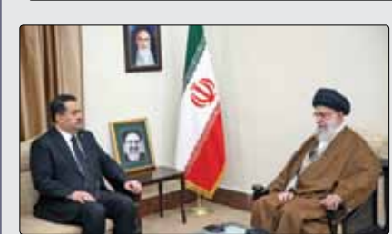
محمد شیاع السودانی، نخست‌وزیر عراق پیش از ظہر دیروز در دیدار با رہبر انقلاب اسلامی، بہ نمایندگی از دولت و ملت این کشور، ضایعہ درگذشت رئیس‌جمهور و وزیر امور خارجه و ہمراہان ایشان را بہ حضرت آیت‌اللہ خامنہ‌ای و ملت ایران تسلیت و تعزیت گفت. بہ گزارش پایگاہ اطلاع‌رسانی دفتر مقام معظم رہبری، آقای سودانی در این دیدار خطاب بہ دیدار انقلاب گفت: در این شرایط متأثرکنندہ بہ دیدار حضر تعالی آمدم تا مراتب حزن، اندوہ و تعزیت دولت و ملت عراق را بہ دولت و ملت ایران اعلام کنم. آنچه ما از آقای رئیسی، رئیس‌جمهور شہید ایران دیدیم چیزی جز صدق، اخلاص، پاکسی، «کار و تلاش» و خدمت بہ مردم نبود. نخست‌وزیر عراق همچنین با اشارہ بہ حضور میلیون‌ها نفر در مراسم تشییع رئیس‌جمهور شہید ایران گفت: تصاویری کہ من از تلویزیون دیدم پیام‌های روشنی داشت کہ مہم‌ترین پیام آن، عمق ارتباط مستحکم مردم با مسوولان در جمہوری اسلامی، بہ‌رغم ہمہ فشارها و تحریم‌ها و این حادثہ ناگوار است. آقای سودانی تأکید کرد: پیام دیگر

محمد شیاع السودانی، نخست‌وزیر عراق پیش از ظہر دیروز در دیدار با رہبر انقلاب اسلامی، بہ نمایندگی از دولت و ملت این کشور، ضایعہ درگذشت رئیس‌جمهور و وزیر امور خارجه و ہمراہان ایشان را بہ حضرت آیت‌اللہ خامنہ‌ای و ملت ایران تسلیت و تعزیت گفت.