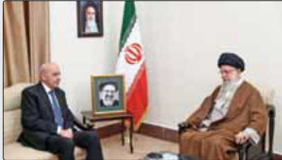
حضرت آیت‌اللہ خامنہ‌ای رہبر انقلاب اسلامی عصر دیروز در دیدار آقای «نبیہ بری» رئیس مجلس لبنان، با قدردانی از ابراز ہمدردی دولت و ملت لبنان در این حادثہ تلخ و سنگین گفتند: اعلام عزای عمومی در لبنان نشانگر کمال ہمراہی ۲ کشور است و ما نسبت خودمان با برادران لبنائی و جناب آقای سیدحسین نصراللہ را نسبت خویشاوندی و برادری می‌دانیم. بہ گزارش پایگاہ اطلاع‌رسانی دفتر مقام معظم رہبری، ایشان حادثہ اخیر را موجب از دست دادن یک شخصیت برجستہ دانستند و خاطر نشان کردند: این موضوع برای ما سخت است اما بہ لطف خداوند، ملت ایران از این حادثہ تلخ بہ‌عنوان یک فرصت استفاده خواهد کرد، ہم‌گونہ کہ در سال‌های گذشتہ از حوادث سخت تولید فرصت شدہ است، رہبر انقلاب اسلامی با اشارہ بہ حرکت ملت ایران در

تشییع رئیس‌جمهور فقید و ہمراہان ایشان افزودند: ملت ما الحمدللہ ملت ایستادہ و بیادری است و اعتماد و توکل ما نیز بہ خدای متعال زیاد است و ان‌شاءاللہ ملت ایران از این حادثہ سود خواهد برد. حضرت آیت‌اللہ خامنہ‌ای همچنین با ابراز خرسندی از ہمدلی موجود میان مجموعہ‌های مقاومت در لبنان و تأیید سخنان آقای نبیہ بری مبنی بر جنگ «چوہد» در منطقہ افزودند: شرایط کنونی منطقہ بہگونہ‌ای است کہ ہم برای دشمن صہیونیست شرایط مرگ و زندگی است و ہم برای جبہہ حق، رہبر انقلاب اسلامی تأکید کردند: ورود لبنان بہ قضایای اخیر فلسطین و غزہ تأثیر عمیقی داشت و اگر چنین کاری انجام نمی‌شد، قطعاً بیشترین خسارت بہ خود لبنان وارد می‌شد. آقای نبیہ بری رئیس مجلس لبنان نیز در این دیدار با اعلام ناراحتی و اندوہ شدید ملت و دولت لبنان لبنائی و جناب آقای سیدحسین نصراللہ را نسبت خویشاوندی و برادری می‌دانیم. بہ گزارش پایگاہ اطلاع‌رسانی دفتر مقام معظم رہبری، ایشان حادثہ اخیر را موجب از دست دادن یک شخصیت برجستہ دانستند و خاطر نشان کردند: این موضوع برای ما سخت است اما بہ لطف خداوند، ملت ایران از این حادثہ تلخ بہ‌عنوان یک فرصت استفاده خواهد کرد، ہم‌گونہ کہ در سال‌های گذشتہ از حوادث سخت تولید فرصت شدہ است، رہبر انقلاب اسلامی با اشارہ بہ حرکت ملت ایران در