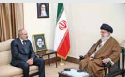
گرہہ سیاسی: حضرت آیت‌اللہ العظمی خامنہ‌ای، رہبر حکیم انقلاب اسلامی در پیامی بہ مناسبت آغاز بہ کار ششمین دورہ مجلس خبرگان رہبری، این مجلس را مظهر مردم‌سالاری اسلامی خواندند و با اشارہ بہ تدبیر ہوشمندانہ معرفت قرآنی و اسلامی در ہم‌جہت ساختن «شربعت و عقلائیت» و «غیب و شہود»، از وجدان‌های بیدار سراسر جہان دعوت کردند ضمن توجہ بہ واقعیت‌های تلخ نظامات دین‌ستیز یا دین‌گریز، در طرح جامع و استوار و گرہ‌گشا و همچنین جذاب و شگفت‌آور حکمرانی اسلامی تأمل کنند. بہ گزارش پایگاہ اطلاع‌رسانی مقام

نیکول پاشینیان، نخست‌وزیر ارمنستان نیز پیش از ظہر دیروز در دیدار با رہبر انقلاب اسلامی مراتب تأثر و ہمدردی ملت و دولت ارمنستان را اعلام کرد. بہ گزارش پایگاہ اطلاع‌رسانی دفتر مقام معظم رہبری، حضرت آیت‌اللہ خامنہ‌ای در این دیدار ضمن قدردانی از ابراز ہمدردی نخست‌وزیر ارمنستان، بہ مشترکات تاریخی و جغرافیایی و منافع مشترک ایران و ارمنستان اشارہ کردند و گفتند: سیاست جمهوری اسلامی ایران مبنی بر گسترش روزافزون روابط با ارمنستان،