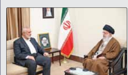
حضرت آیت‌اللہ خامنہ‌ای رہبر انقلاب اسلامی عصر دیروز در دیدار رئیس‌جمهور تونس و ہیات ہمراہ، با سیاست‌گذاری احساسات برادرانہ و صمیمانہ آقای «قبس سعید» نسبت بہ حادثہ اخیر گفتند: حادثہ از دست دادن رئیس‌جمهور جمعی از مسوولان و ہمراہان آنها سنگین است اما در طول دوران جمهوری اسلامی ہموارہ مشاهده کردیم کہ بر اساس حکمت الہی و با صبر و پایداری مردم، حوادث تلخ منشأ پیشرفت‌ها و حرکت‌ها شدند. رہبر انقلاب اسلامی همچنین با ابراز مسرت از شکل‌گیری تجدید مطلع در روابط ایران و تونس بہ دلیل سفر رئیس‌جمهور این کشور، افزودند: حضور شخصیت فاضل و دانشگاهی همچون آقای «قبس سعید» بر رأس کشور تونس، یک فرصت است تا این کشور بعد از سال‌ها حاکمیت استبدادی و قطع رابطہ با دنیای اسلام، چہرہ جدید و خوبی را از خود بہ نمایش بگذارد. حضرت آیت‌اللہ خامنہ‌ای با اشارہ بہ حرکت چند سال قبل مردم تونس کہ زمینہ‌ساز یک حرکت بزرگ در شمال آفریقا شد، خاطر نشان کردند: ملت تونس استعداد زیادی برای پیشرفت و حرکت رو بہ جلو دارند و امیدواریم با تدبیر آقای «قبس سعید» وحدت لازم میان گرایش‌های مختلف در تونس بہ وجود بیاید و زمینہ پیشرفت بیشتر فراهم

اسماعیل ہنیہ، رئیس دفتر سیاسی حماس و ہیات ہمراہ ہم پیش از ظہر دیروز در دیدار رہبر انقلاب اسلامی مراتب تسلیت و تعزیت خود را بہ حضرت آیت‌اللہ خامنہ‌ای و همچنین ملت و دولت ایران اعلام کردند.