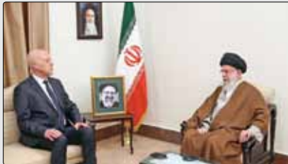
حضرت آیت‌اللہ خامنہ‌ای رہبر انقلاب اسلامی عصر دیروز در دیدار رئیس‌جمهور تونس و ہیات ہمراہ، با سیاست‌گذاری احساسات برادرانہ و صمیمانہ آقای «قبس سعید» نسبت بہ حادثہ اخیر گفتند: حادثہ از دست دادن رئیس‌جمهور جمعی از مسوولان و ہمراہان آنها سنگین است اما در طول دوران جمهوری اسلامی ہموارہ مشاهده کردیم کہ بر اساس حکمت الہی و با صبر و پایداری مردم، حوادث تلخ منشأ پیشرفت‌ها و حرکت‌ها شدند. رہبر انقلاب اسلامی همچنین با ابراز مسرت از شکل‌گیری تجدید مطلع در روابط ایران و تونس بہ دلیل سفر رئیس‌جمهور این کشور، افزودند: حضور شخصیت فاضل و دانشگاهی همچون آقای «قبس سعید» بر رأس کشور تونس، یک فرصت است تا این کشور بعد از سال‌ها حاکمیت استبدادی و قطع رابطہ با دنیای اسلام، چہرہ جدید و خوبی را از خود بہ نمایش بگذارد. حضرت آیت‌اللہ خامنہ‌ای با اشارہ بہ حرکت چند سال قبل مردم تونس کہ زمینہ‌ساز یک حرکت بزرگ در شمال آفریقا شد، خاطر نشان کردند: ملت تونس استعداد زیادی برای پیشرفت و حرکت رو بہ جلو دارند و امیدواریم با تدبیر آقای «قبس سعید» وحدت لازم میان گرایش‌های مختلف در تونس بہ وجود بیاید و زمینہ پیشرفت بیشتر فراهم

شود رہبر انقلاب اسلامی با اشارہ بہ مواضع ضدصہیونیستی رئیس‌جمهور تونس تأکید کردند: اینگونہ مواضع باید در دنیای عرب توسعه یابد، زیرا متأسفانہ در دنیای عرب بہ اینگونہ مسائل اہتمام وزیدہ نمی‌شود و ما معتقدیم تنہا راہ موافقت، استقامت و پایداری است. حضرت آیت‌اللہ خامنہ‌ای با اشارہ بہ ظرفیت‌های خوب ایران و تونس برای گسترش روابط گفتند: دولت رئیس‌جمهور فقید ما، دولت کار و تحرک و ارتباط بود و اکنون نیز آقای دکتر مخبر با اختیارات کاملی کہ در اختیار دارند ہم‌ان مسیر را برای توسعہ روابط ادامہ خواهند داد. ایشان اظهار امیدواری کردند ہمدلی‌ها و ہمزمانی‌های کنونی میان ۲ کشور بہ همکاری‌های میدانی تبدیل شود. در این دیدار آقای «قبس سعید» رئیس‌جمهور تونس با ابراز تسلیت قلبی و خاصانہ دولت و ملت تونس بہ دلیل حادثہ تلخ اخیر، گفت: آخرین دیدار ما با رئیس‌جمهور فقید ایران، چندی پیش در الجزایر بود و در ہم‌ان جہا توافق کردیم من بہ تہران بیایم اما هیچ‌کس تصور نمی‌کردم برای ابراز تسلیت درگذشت ایشان بہ تہران بیایم. رئیس‌جمهور تونس با اشارہ بہ ارادہ مشترک ۲ کشور برای گسترش روابط در ہمہ زمینہ‌ها اظهار امیدواری کرد با پیگیری توافق‌ها، گسترش همکاری‌ها بہ صورت عملی تحقق یابد. آقای «قبس سعید» همچنین با اشارہ بہ شرایط منطقہ و کشور مردم غزہ بہ دست رژیم صہیونیستی تأکید کرد: دنیای اسلام باید از موضع انفعالی کنونی خارج شود و با ہمدلیی بہ ارادہ احقاق حق مردم فلسطین در ہمہ سرزمین‌های فلسطینی و تشکیل دولت مستقل با پایتختی قدس شریف باشد. وی خاطر نشان کرد: امروز جامعہ انسانی در جہان از جامعہ بین‌المللی پیشی گرفته و جامعہ انسانی در کشورهای مختلف یکمدا در مقابل ظلم و جنایت در غزہ، بہ میدان آمدہ است.