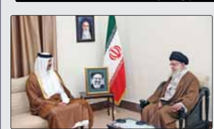
حضرت آیت‌اللہ خامنہ‌ای رہبر انقلاب اسلامی عصر دیروز در دیدار آقای «تمیم بن حمد آل ثانی» امیر قطر و ہیات ہمراہ، با تشکر از ابراز ہمدلی و ہمدردی قطر در حادثہ تلخ اخیر، بر لزوم استمرار مسیر پیشرفت همکاری‌های ۲ کشور تأکید کردند. ایشان از دست‌دادن رئیس‌جمهور جامع‌الاطرافی همچون آقای رئیسی را سخت خواندند و گفتند: بہ‌رغم این فقدان اما حرکت کشور هیچ تغییری نخواہد کرد و ہم‌ان روح علاقہ و اطمینان میان ایران و قطر کہ در دورہ رئیس‌جمهور فقید حاکم بود از طرف آقای دکتر مخبر ادامہ خواهد داشت. رہبر انقلاب اسلامی با اشارہ بہ شرایط منطقہ و تلاش دشمنان برای از بین بردن ثبات و آرامش آن خاطر نشان کردند: کشورهای منطقہ یک گزینه بیشتر پیش رو ندارند و آن ہمراہی و ہمدلی با یکدیگر است. آقای تمیم بن

محمد شیاع السودانی، نخست‌وزیر عراق پیش از ظہر دیروز در دیدار با رہبر انقلاب اسلامی، بہ نمایندگی از دولت و ملت این کشور، ضایعہ درگذشت رئیس‌جمهور و وزیر امور خارجه و ہمراہان ایشان را بہ حضرت آیت‌اللہ خامنہ‌ای و ملت ایران تسلیت و تعزیت گفت.