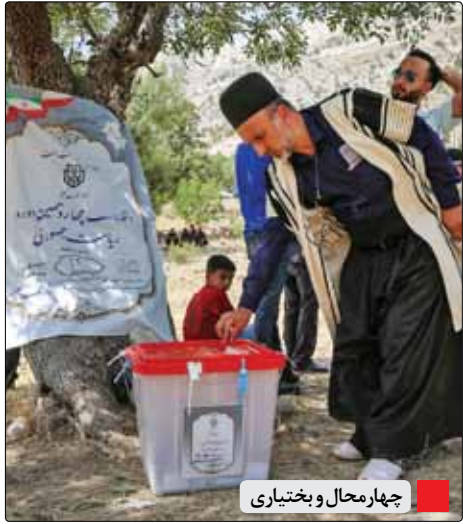
چهارمحال و بختیاری