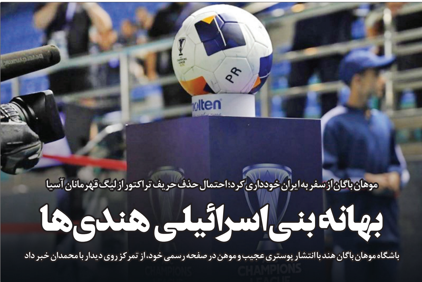
موهان باگان از سفر به ایران خودداری کرد؛ احتمال حذف حریف تراکتور از لیگ قهرمانان آسیا

داری مادرید بین تیم‌های فوتبال اتلتیکو و رئال به تساوی انجامید. در مهم‌ترین بازی هفته هشتم لالیگا اسپانیا و از ساعت ۲۲:۳۰ یکشنبه تیم فوتبال رئال مادرید در ورزشگاه متروپولیتانو اتلتیکو به میدان رفت تا ۲ تیم برگزارکننده داری حساس مادرید باشند. در نهایت این بازی سنتی و همواره پرحاشیه به تساوی یک - یک انجامید. گل‌های داری مادرید توسط میلیتانو (۶۴) برای رئال و آنخل کورا (۹۰+۵) برای اتلتیکو به ثمر رسید.