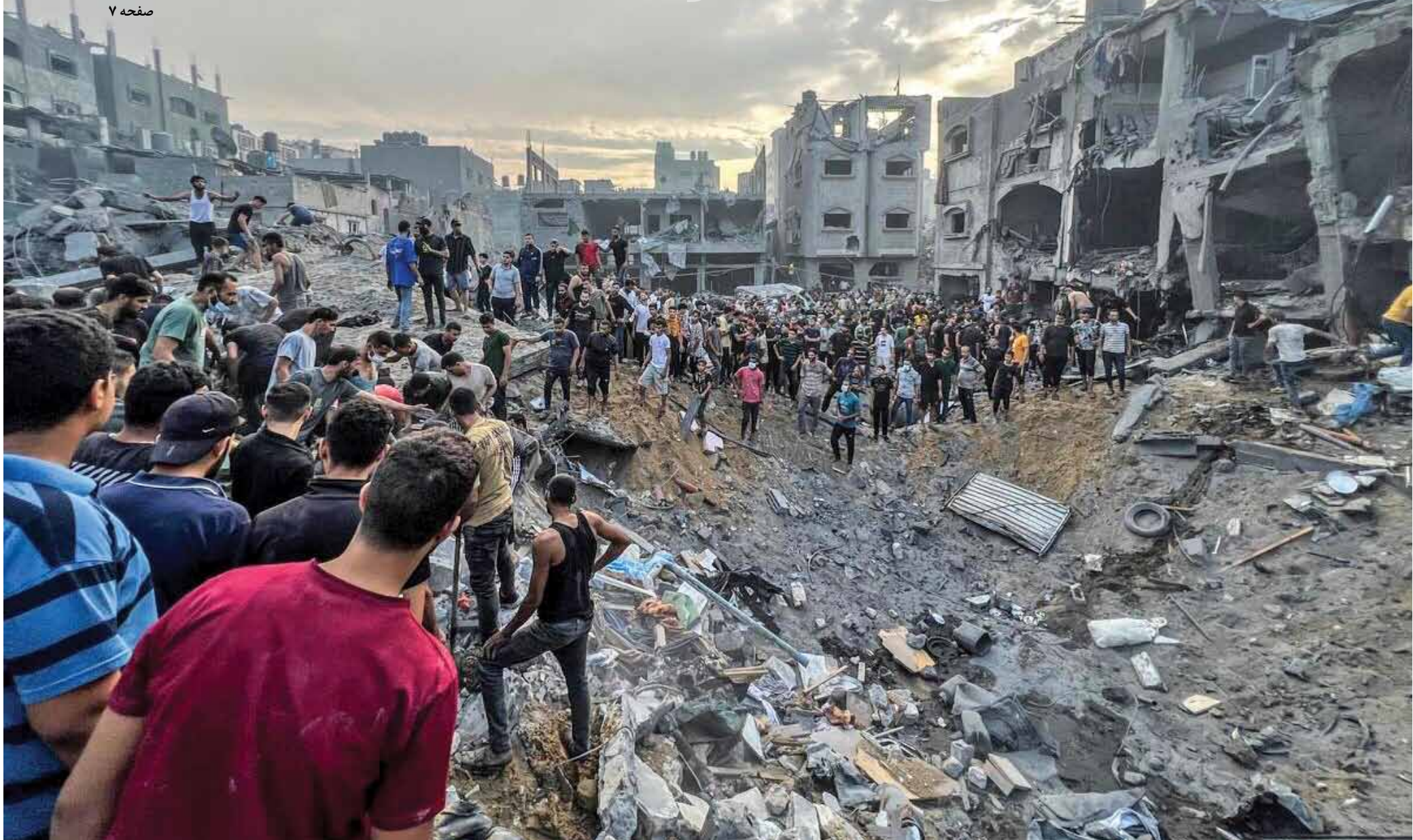
طرح شیطان‌ی رژیم صهیونیستی برای کوچاندن اجباری فلسطینیان شمال غزه محاصره، جلوگیری از ورود مواد غذایی و بمباران روزانه