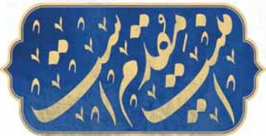
گرامیداشت دهمین سالگرد شهادت دانشمند برجسته پاپوسای بی‌ادما و سردار عالیقدر سرلشکر پاسدار شهید حسن تهرانی مقدم