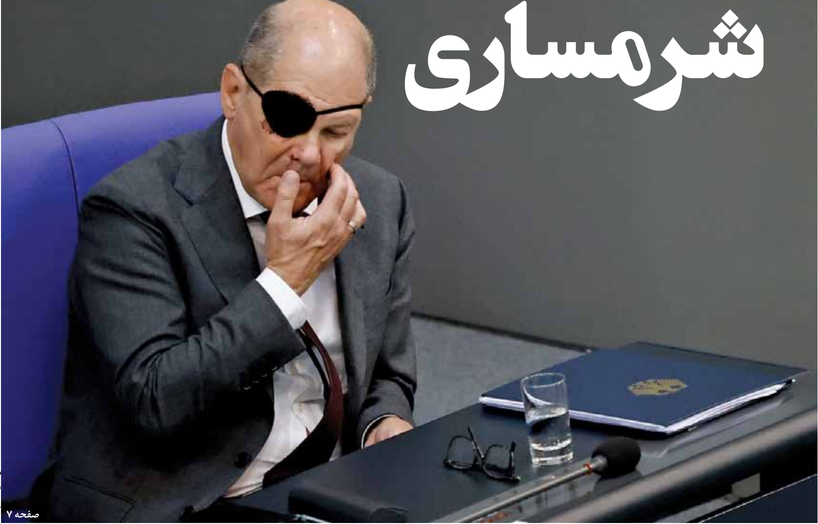
صفحه ۷