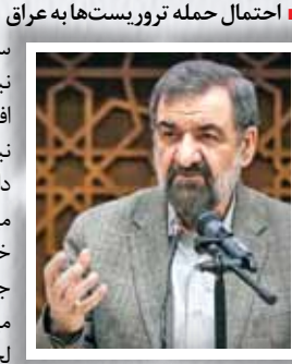
■ احتمال حمله تروریست‌ها به عراق

در همین راستا اخیراً سرلشکر سیدعبدالرحیم موسوی، فرمانده کل ارتش جمهوری اسلامی ایران با بیان اینکه مردم بابت آمادگی نیروهای مسلح خیال‌شان راحت باشد، گفت: در نظام مقدس جمهوری اسلامی ایران همه ملت با هم از آرمان‌های کشور دفاع می‌کنند. امیر موسوی اظهار کرد: نیروهای مسلح وظیفه دارند همواره برای مقابله با هر گونه تهدیدی که متصور است، خود را آماده کنند و این آمادگی به طور دائم وجود دارد. وی افزود: کشور ما تنها متکی به نیروهای مسلح نیست؛ در نظام مقدس جمهوری اسلامی ایران همه ملت با هم از آرمان‌های کشور دفاع می‌کنند.