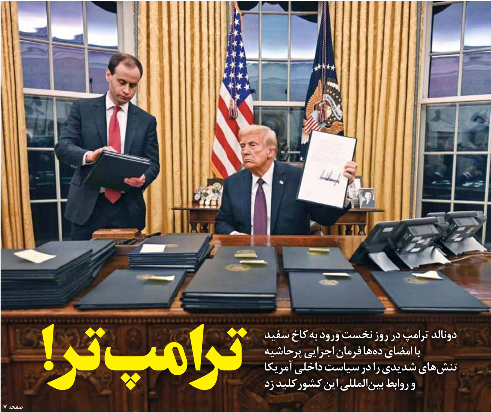
دونالد ترامپ در نشانی کاخ سفید، فرمان‌های اجرایی پرحاشیه را در روز نخست در کاخ سفید امضا کرد. او با امضای ده‌ها فرمان، سیاست خارجی آمریکا را به سوی بی‌ثباتی سوق داد.

«ریسپانسیبیل استیت گرفت» سقوط سیاست خارجی آمریکا را بررسی کرد