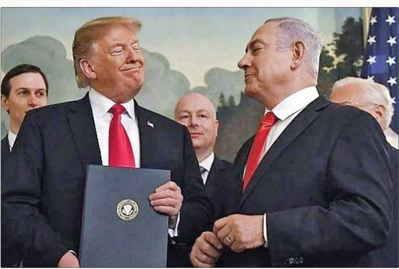
دونالد ترامپ و بنیامین نتانیاهو در کاخ سفید

ترامپ در حالی از مذاکره با ایران گفت که هم‌زمان با امضای یک یادداشت، زمینه‌اعمال تشدید تحریم‌ها علیه کشورمان را ایجاد کرد