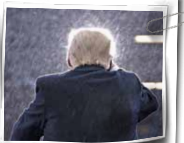
«وطن امروز» گزارش می‌دهد: چرا اولتیماتوم ترامپ به حماس درباره تبادل اسرا یک بلوف است