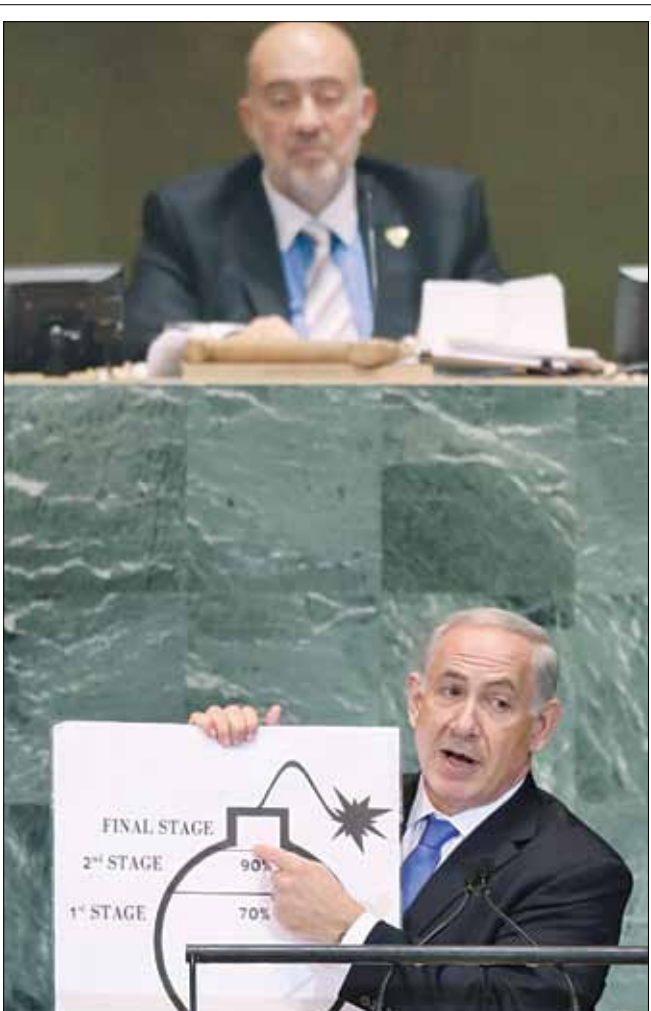
تحلیل نشریه آمریکایی «آتلانتیک» از رفع نگرانی‌های صهیونیست‌ها در مذاکرات هسته‌ای

توافق ژنو نتیجه نقاشی «ننانیاهو» بود صفحه ۲