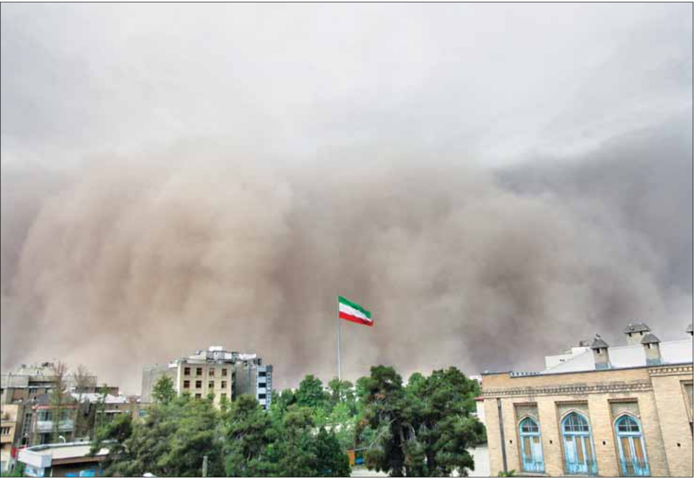
عکس از تپه‌ای در جنوب تهران.

چهارشنبه(امروز و فردا) در مناطق شمال غرب، دامنه‌های البرز، دامنه‌های زاگرس، مرکز، شمال شرق و شرق کشور در بعد از ظهر و شب وزش باد، رگبار، رعد و برق و در مناطق مستعد بارش تگرگ رخ خواهد داد.